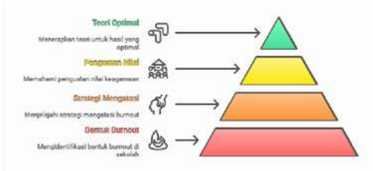
Gambar Hierarki Penguatan Nilai Keagamaan